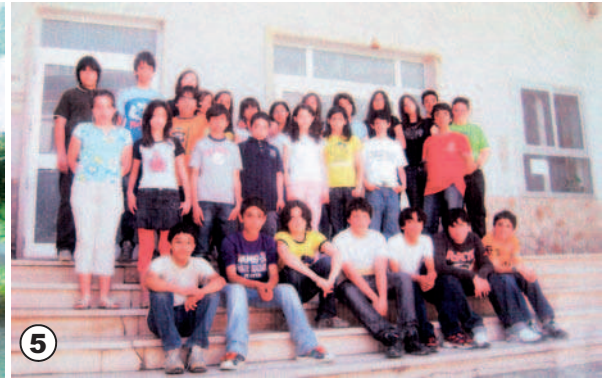
5. Classi 1 a , 2 a e 3 a , scuola media di Motta Montecorvino (FG).