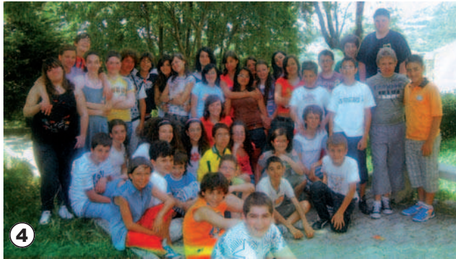
4. Scuola media "Mons. Savastio", Volturino (FG).