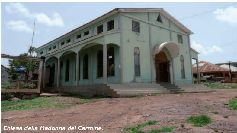
Chiesa della Madonna del Carmine.

È bello quando posso dire "sono ricco di ciò che ho dato"