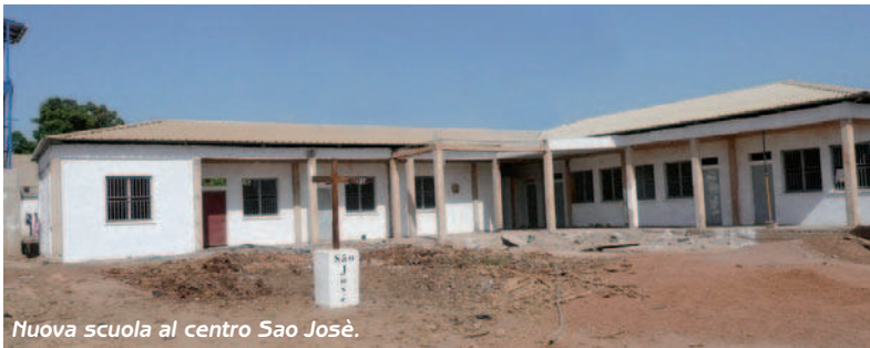
Nuova scuola al centro Sao José.