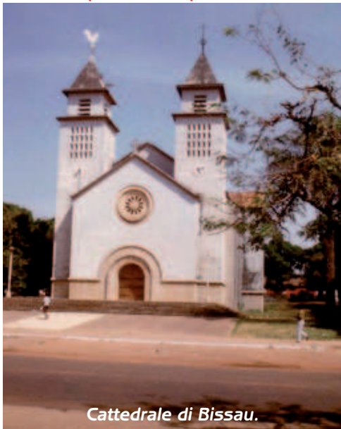
Cattedrale di Bissau.