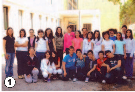
1. Classe 3 a B, scuola media "Don Minzoni", S. Pietro Vermotico (BR).